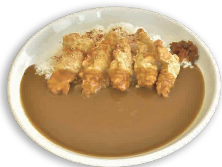
3 とり天カレー ¥750