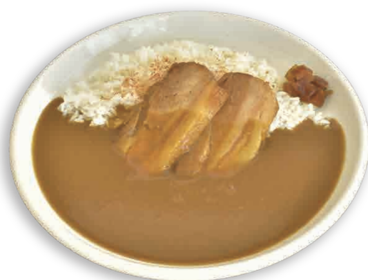
9 豚バラ煮込みカレー ¥950