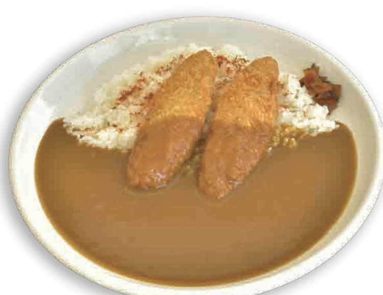
4 フィッシュフライカレー ¥650