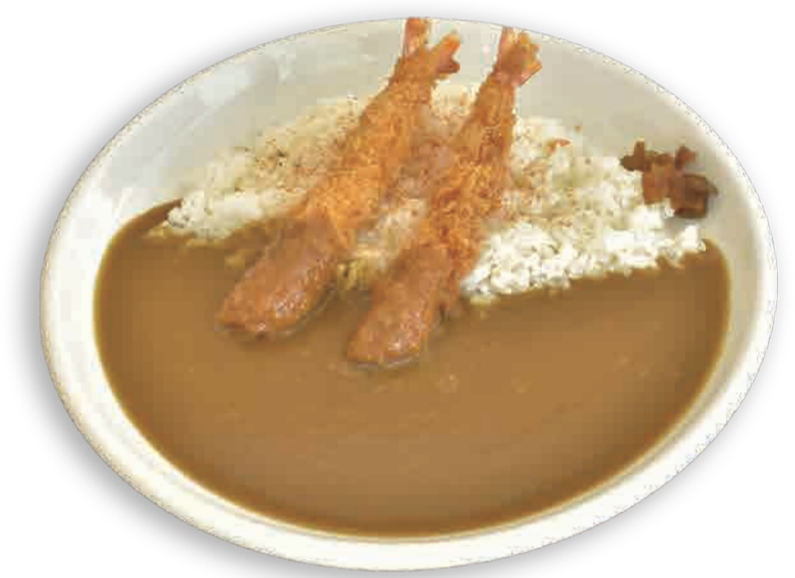
5 海老フライカレー ¥850